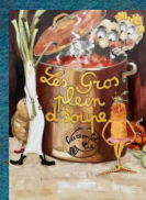
LES GROS PLEIN D'SOUBE 19/10 - 3/11