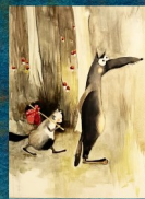
LES TROIS AUTRES PETITS COCHONS 07 - 08/12