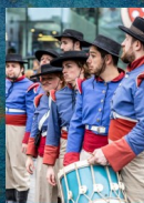
QUATRE GUITARES POUR ZORRO 06 au 09/06