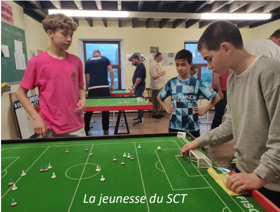
La jeunesse du SCT

Pour ceux qui aimeraient connaître le Subbutéo, le club est ouvert les vendredis de 19h30 à 23h30 à la maison des associations.