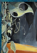
JACK ET LE HARICOT MAGIQUE 22 - 23/03