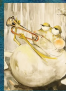
HANSEL ET GRETEL 26 au 30/12