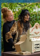
FESTIVAL AU CLAIR DE LA LUNE 26/04