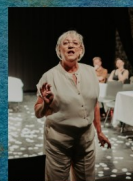
LA COURBE DU U 09/11