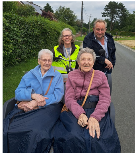
Le vélo sans âge - chouette rencontre à Temploux le 3 juin 2024.