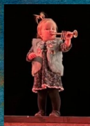
PRÉSENTATION DE LA SAISON 2025-2026 14/06