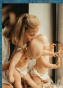
FESTIVAL AU CLAIR DE LA BULLE 16 au 18/05