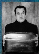
LE CIRQUE DES MIRAGES 29/01